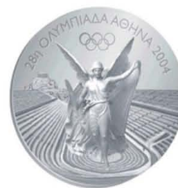
Медали Олимпийских игр