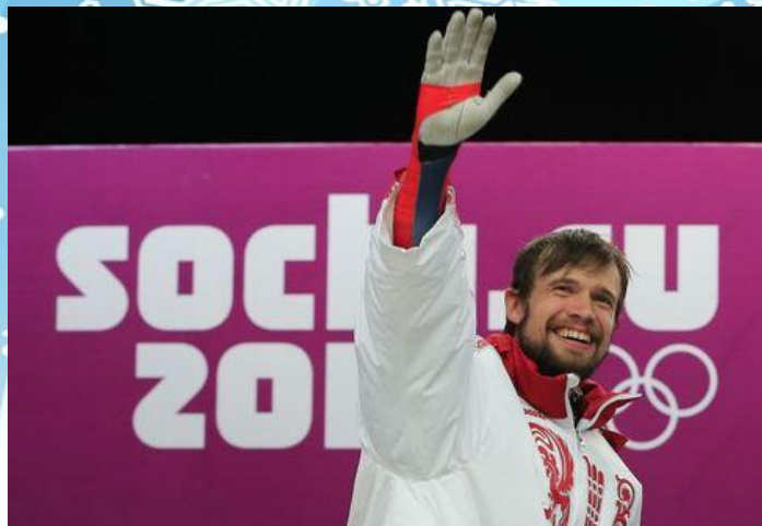
Александр Третьяков - олимпийский чемпион в скелетоне!