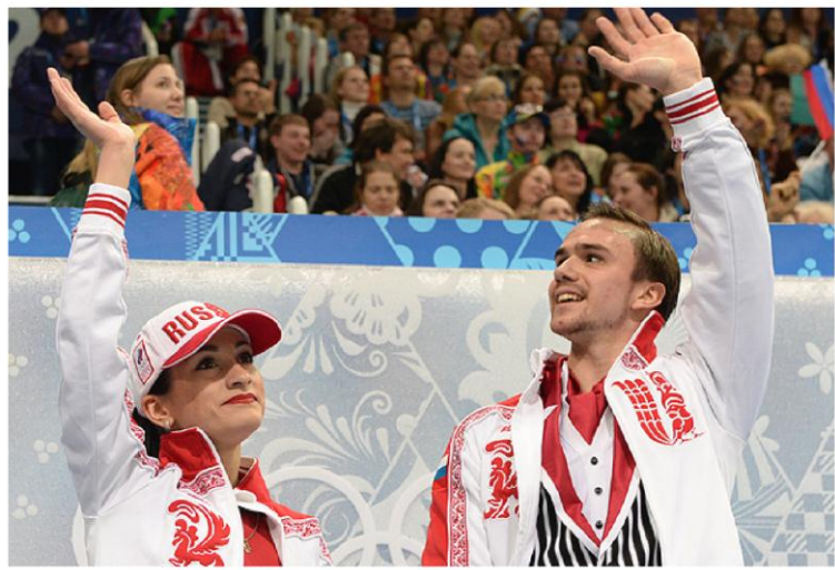
Ксения Столбова и Федор Климов приветствуют публику