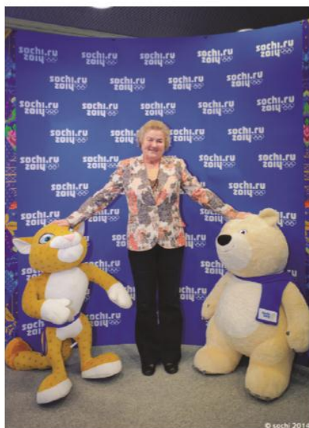
Легендарная спортсменка, шестикратная олимпийская чемпионка Лидия Скобликова

Ольга находится в отличной форме, к тому же, ей прекрасно знакомы дорожки «Адлер-Арены», в которой будут проходить олимпийские состязания. Именно там в 2013 году проходил чемпионат мира на отдельных дистанциях, и именно там Фаткулина завоевала золото в беге на 1000 метров.