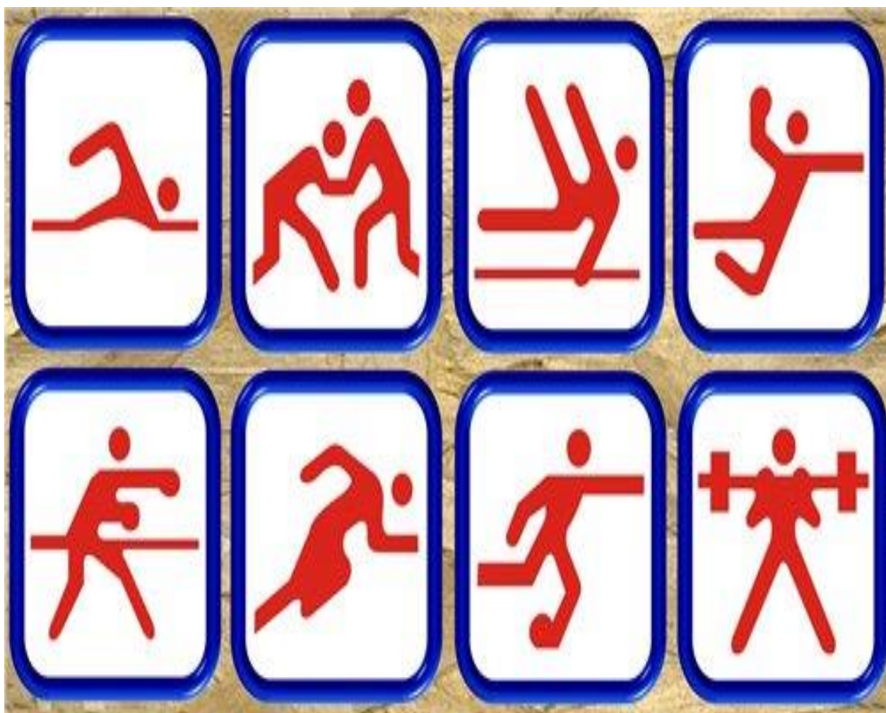
Рис 1 «Быстрее Выше Сильнее»

В связи с этим был разработан сценарий мероприятия «Малые олимпийские игры» содержащий ряд эстафет, которые подготавливают к сдаче норм ГТО учащихся 5-11 классов. (Прыжки в длину с места, лыжные гонки и.т.д)