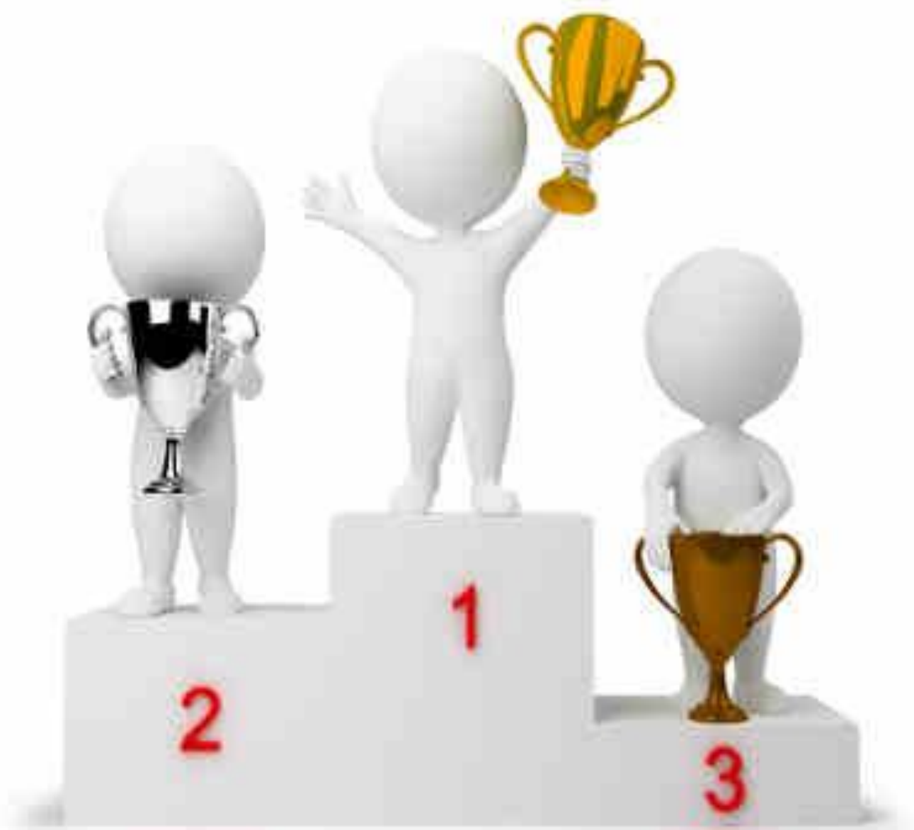
Рис 8 «Награждение»