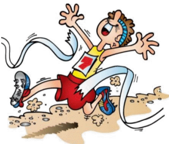
Рис 2 «Бегун»

Эстафета «Колесница». Участники каждой команды встают по двое: один - «наездник», другой «лошадь». «Наездник» набрасывает на «лошадь» скакалку и держится за ее ручки. По сигналу дети бегут до «столба» (кегли), поворачиваются и возвращаются к своей команде. Передают скакалку следующей паре. Побеждает колесница, первой закончившая эстафету.